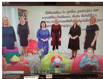
Jelgavas pilsētas bibliotēkas bibliotekāru ansamblis "ZINOŠĀ PĀRLIELUPES MIEŽIŅE JELGAVĀ"