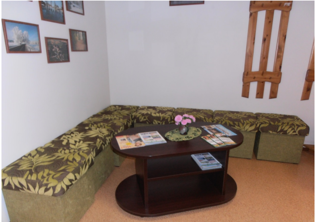
Jaunizveidotais atpūtas stūrītis