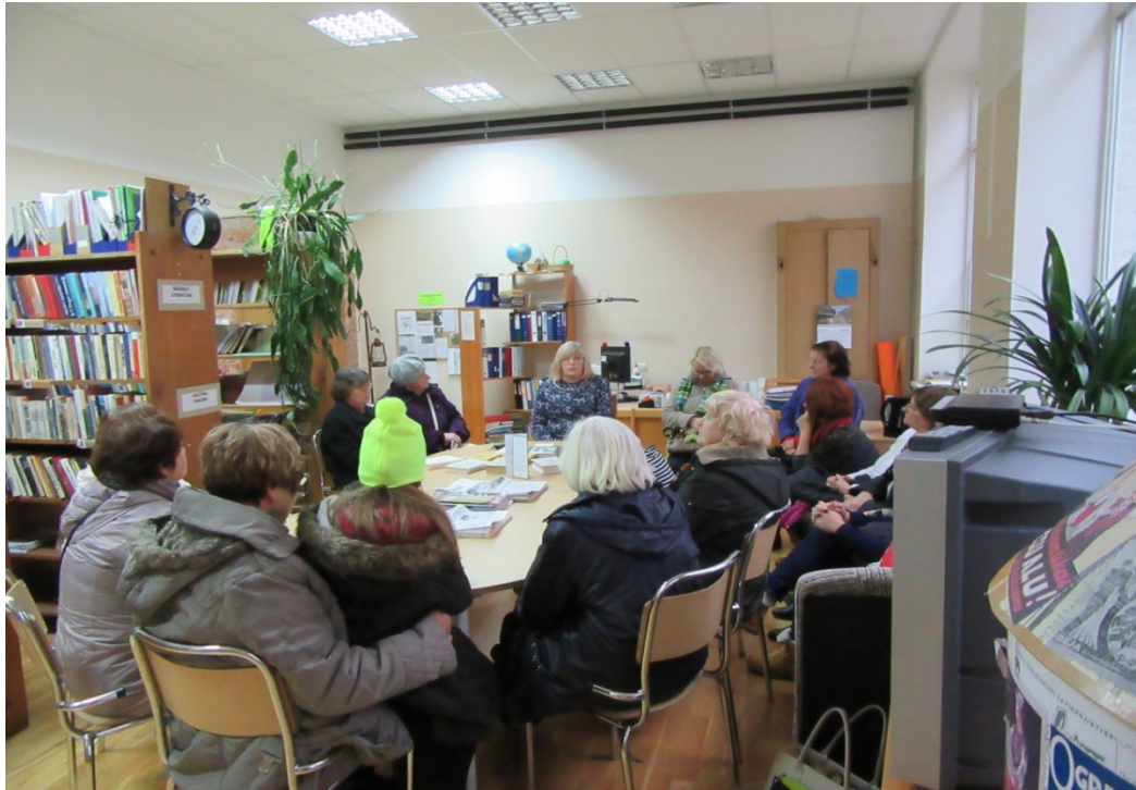
Ekskursijas laikā-Drabešu internātskolas bibliotēkā