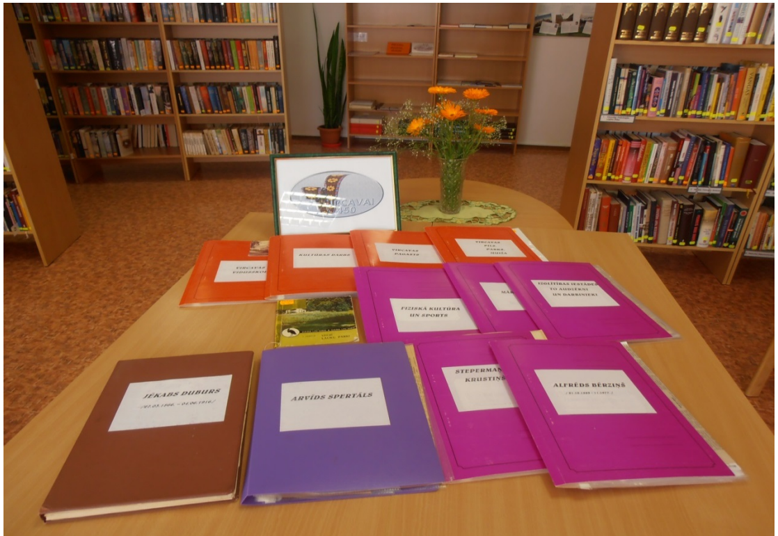
Novadpētniecības izstāde "Vircavai-450"