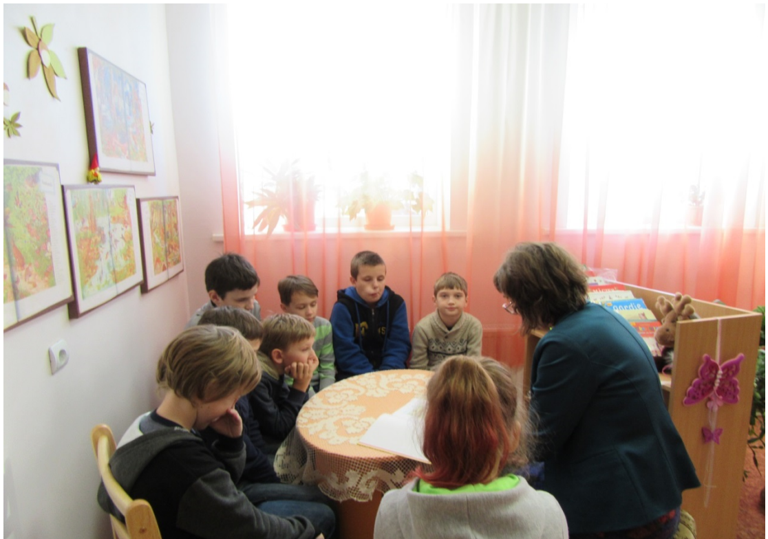
Vircavas vidusskolas 4. Klases skolēni un audzinātāja bibliotēkā lasa grāmatas