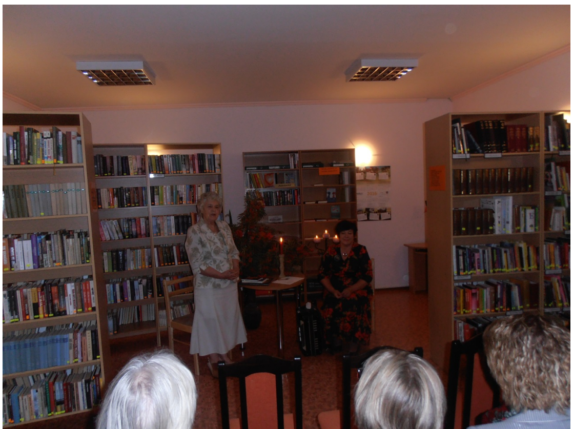
Tikšanās ar dzejnieci Upesleju un komponisti Stikāni